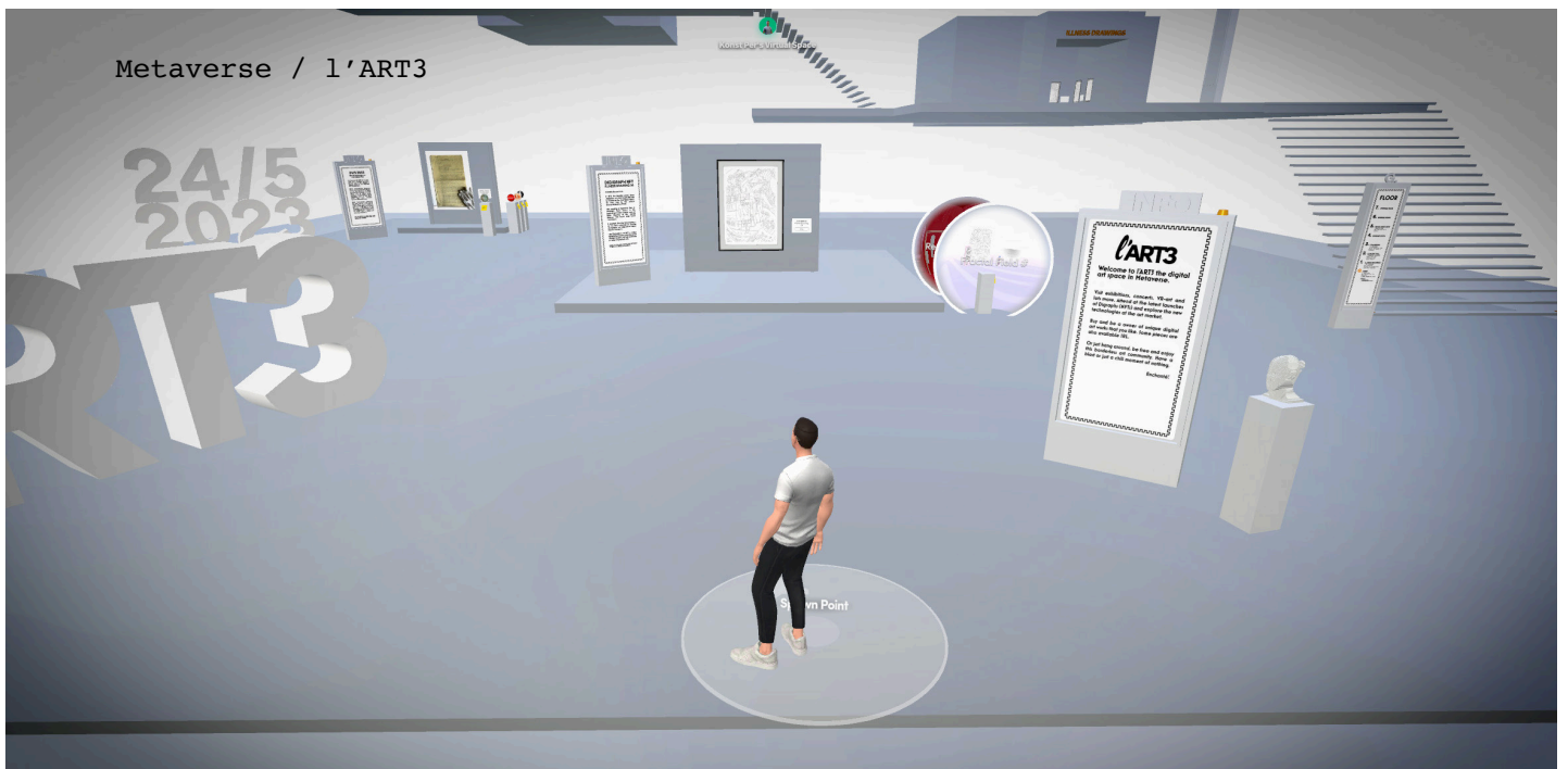
Ernst&Per Josephson / Sjukdomsteckningar

För intervjuförfrågan mejla: konst@perjosephson.se