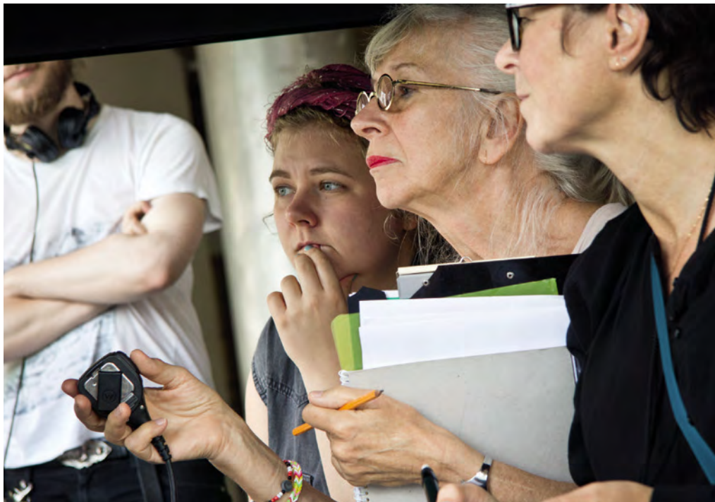
Suzanne Osten har filmat hela sommaren. Här med några i filmteamet.

– Det jag minns som svårt var mammans nattliga gråtattacker. Dem kunde jag inte att stoppa. I min fantasi pågick de jämt. Det har jag plockat in i filmen. I den scenen ligger flickan och tänker att nu börjar mamma gråta igen, och då är det som om hela rummet fylls av tårar.