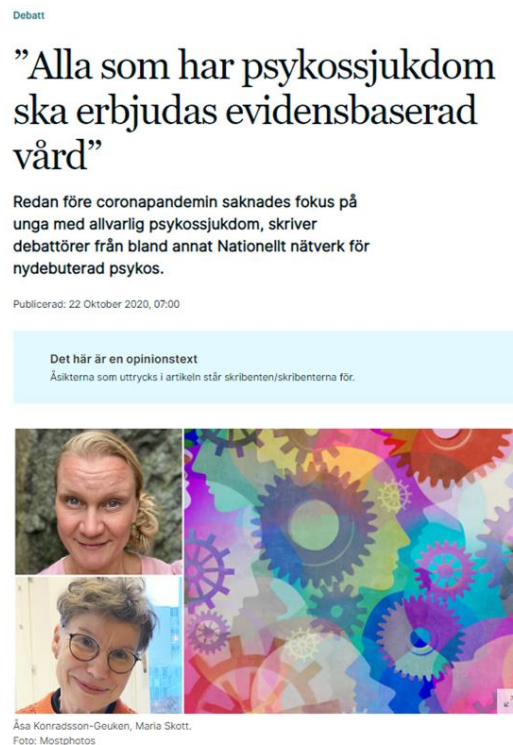
Dagens Medicin oktober 2020