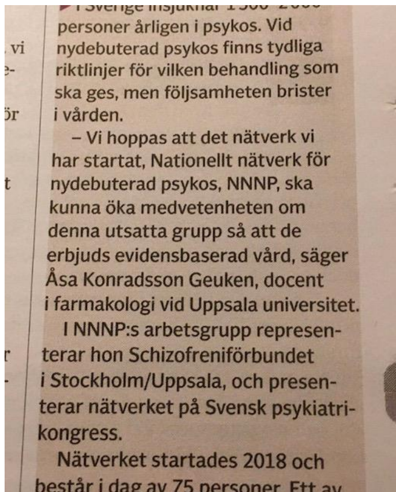
Dagens Medicin mars 2020